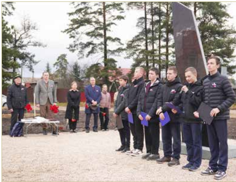
На открытии памятника ребята читали свои стихи, посвящённые лётчикам.

— Главное — первый поворот. Взлёт, прямая и тот самый поворот. Не опрокинуло бы, не уйти бы в штопор. Прошёл, и всё — ты уже почти спокоен. Поднимаешь модель выше, там есть время на корректировку, если что-то не так. Затем — посадка. Тоже не так просто, особенно если модель большая, с размахом крыльев метра полтора. Стараешься держать ручку газа повыше, заходить плавно. А потом хватаешь свой самолёт