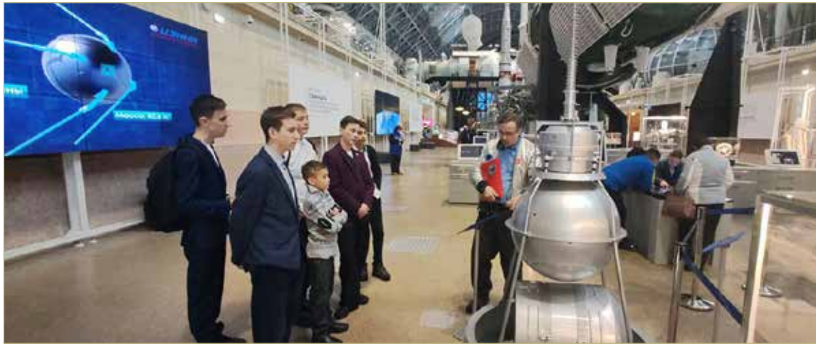
Космический день в Москве — посещение ВДНХ.

Хвойная всегда будет с крыльями, даже не сомневайтесь.