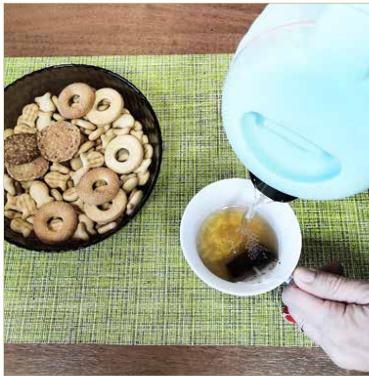
Заваривать чай в пакетиках можно без опасений для здоровья.

Но есть и хорошая новость. Для заваривания чая и приготовления пищи люди используют питьевую воду, которая прошла механическую и химическую обработку, фильтрацию и дезинфекцию. Содержание вредных веществ в ней минимальное. Так что можно не опасаться и заваривать любимым многими соотечественниками чай в пакетиках, используя питьевую воду.