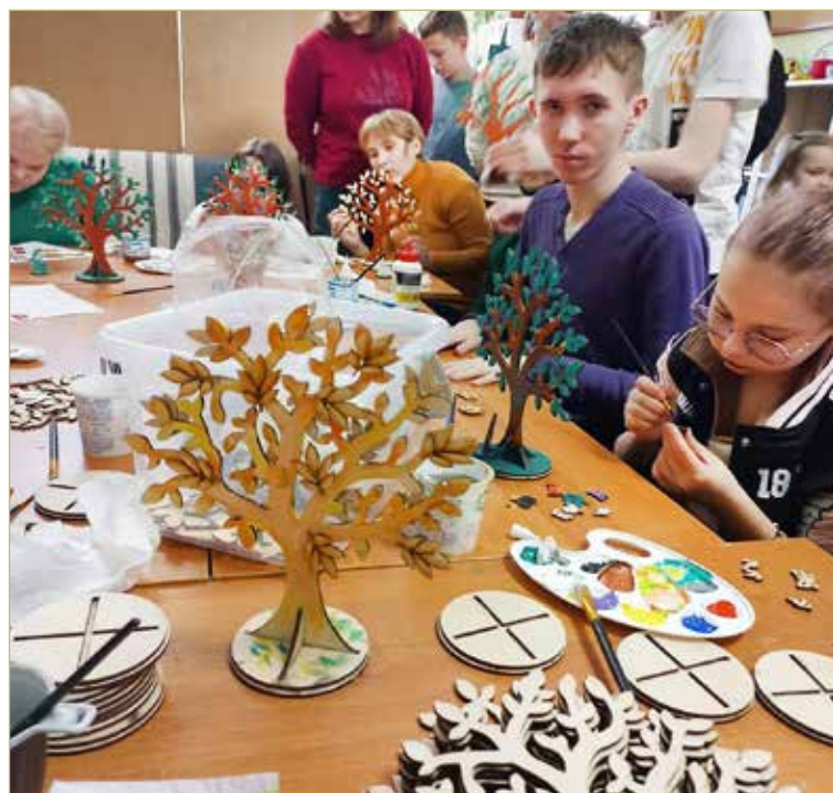
Самое главное — занятия в мастерских дают детям и подросткам с инвалидностью общение и реализацию себя в творчестве.