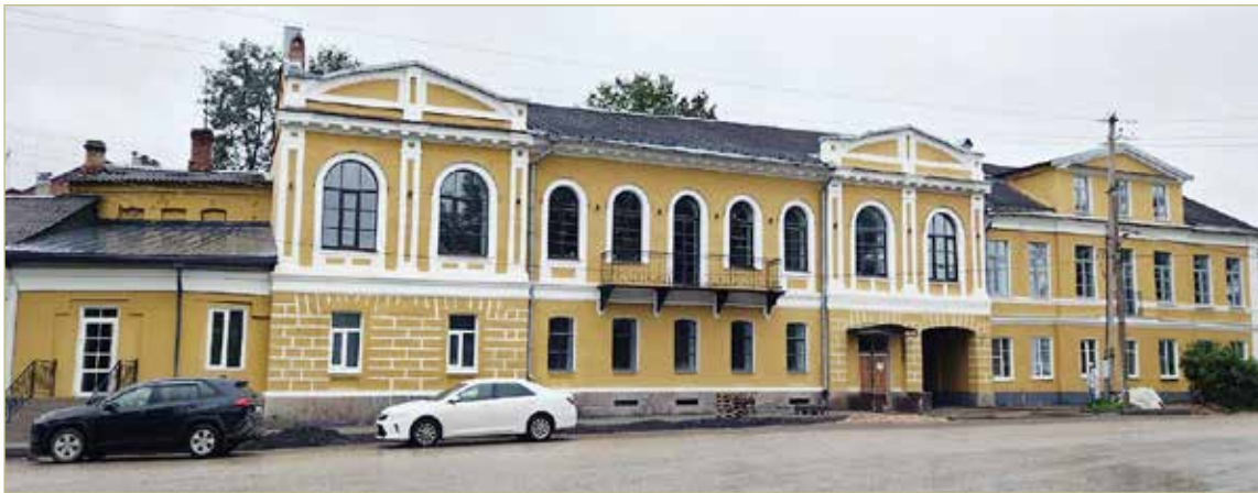
При реставрации в здании восстановили и сохранили уникальные детали архитектуры XIX века.

Новый владелец приобрёл большую часть помещений, чтобы создать в старых, но крепких стенах бизнес-центр премиум-