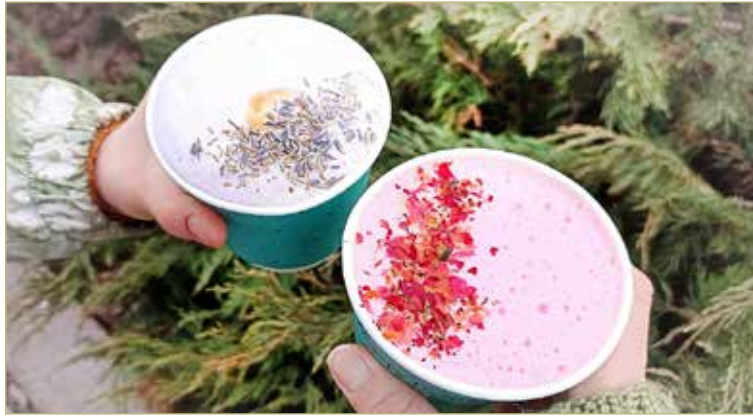
По замыслу создателей пенки, кофе должен быть не только вкусным, но и красивым.