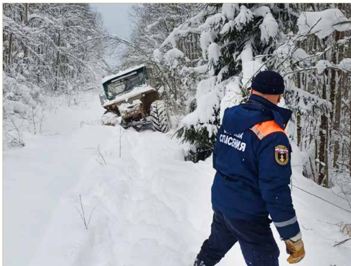
Чтобы по лесному бездорожью преодолеть 9 км до Погостища, спасателям понадобилось 9 часов.